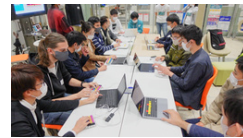
※ハードウェアをパソコンに繋ぎ、演奏会を実施。

人々に音楽を用いた交流機会を平等に提供するために、楽器を弾くことが苦手な方や未経験者には、ParoToneを使ってもらうことで、演奏者として「e-Symphony」に参加してもらっています。