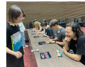
※学祭や体験会ではアプリ版を使用。楽器経験の有無を問わず多くの人が音楽を楽しめる。